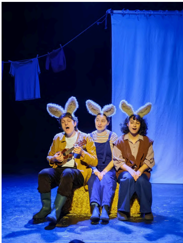
Photos issues de répétitions ou de représentations (2025)