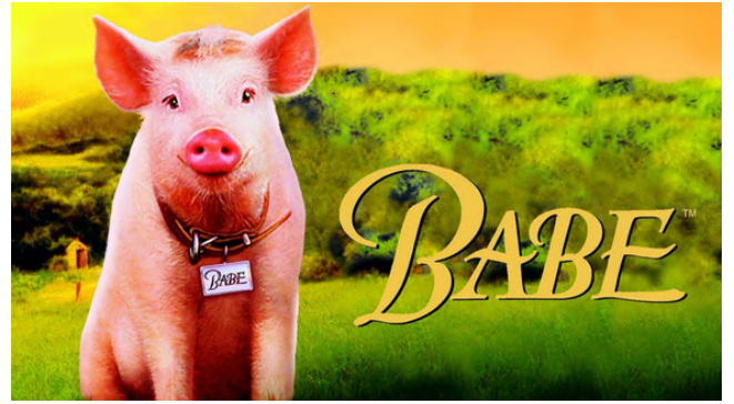
Film Babe (1995)