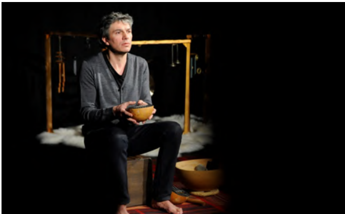
Concert pour les tout-petits Compagnie Le Pli de la Voix