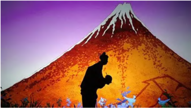
Film Princes et princesses (2000)